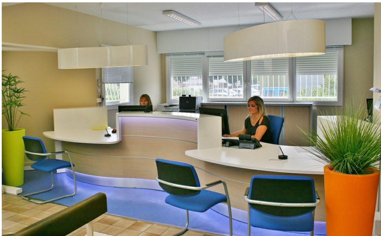
Espace d'accueil de la clientèle, entièrement rénové en 2016, au siège de Villefontaine (Cliquez sur l'image pour l'agrandir)

Nombre d'agents rattachés au Pôle Administratif et Clients : 13 personnes