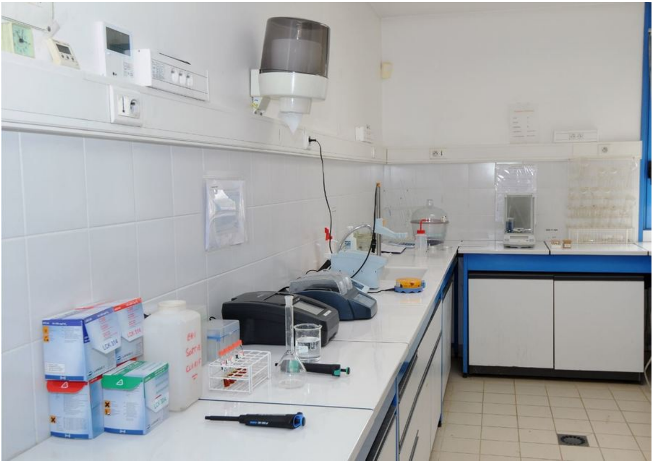
Le laboratoire d'analyse des eaux usées à la station de Traffeyère (Cliquez sur l'image pour l'agrandir)