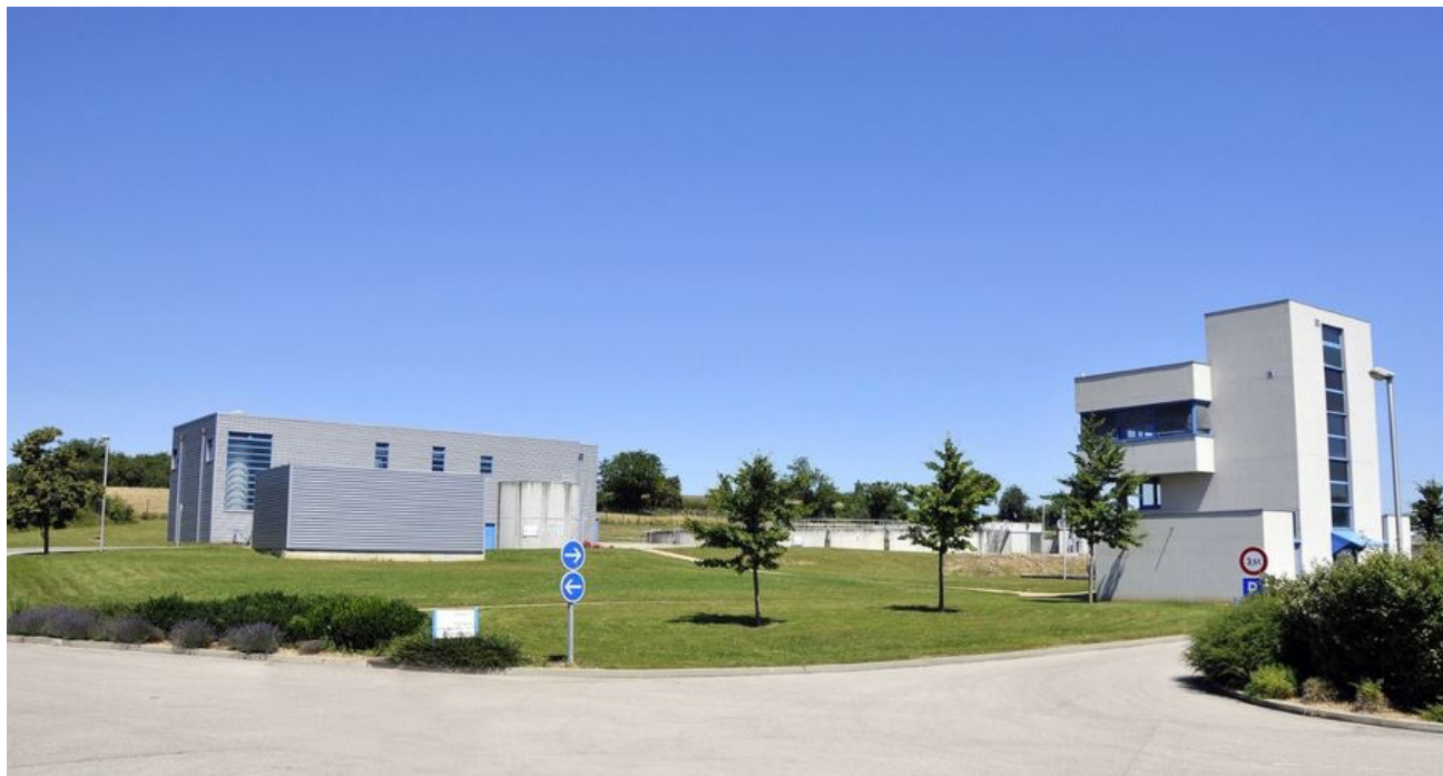
Le site de Traffeyère sur la commune de Saint-Quentin-Fallavier (Cliquez sur l'image pour l'agrandir)