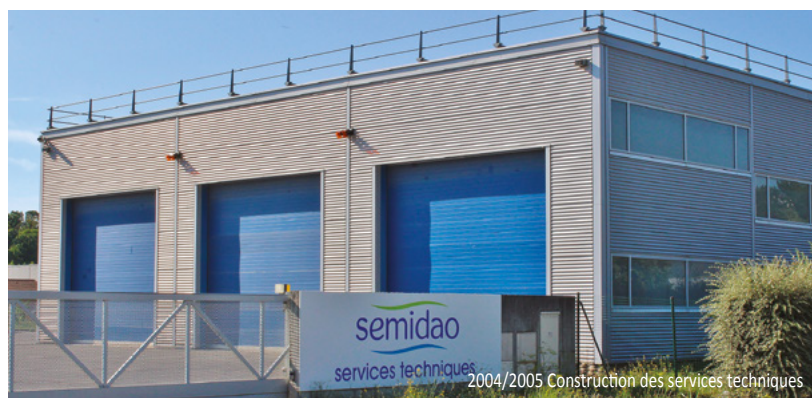
2004/2005 Construction des services techniques