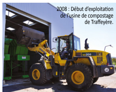
2008 : Début d'exploitation de l'usine de compostage de Traffeyère.