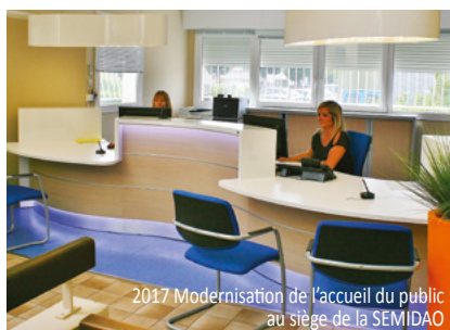
2017 Modernisation de l'accueil du public au siège de la SEMIDAO