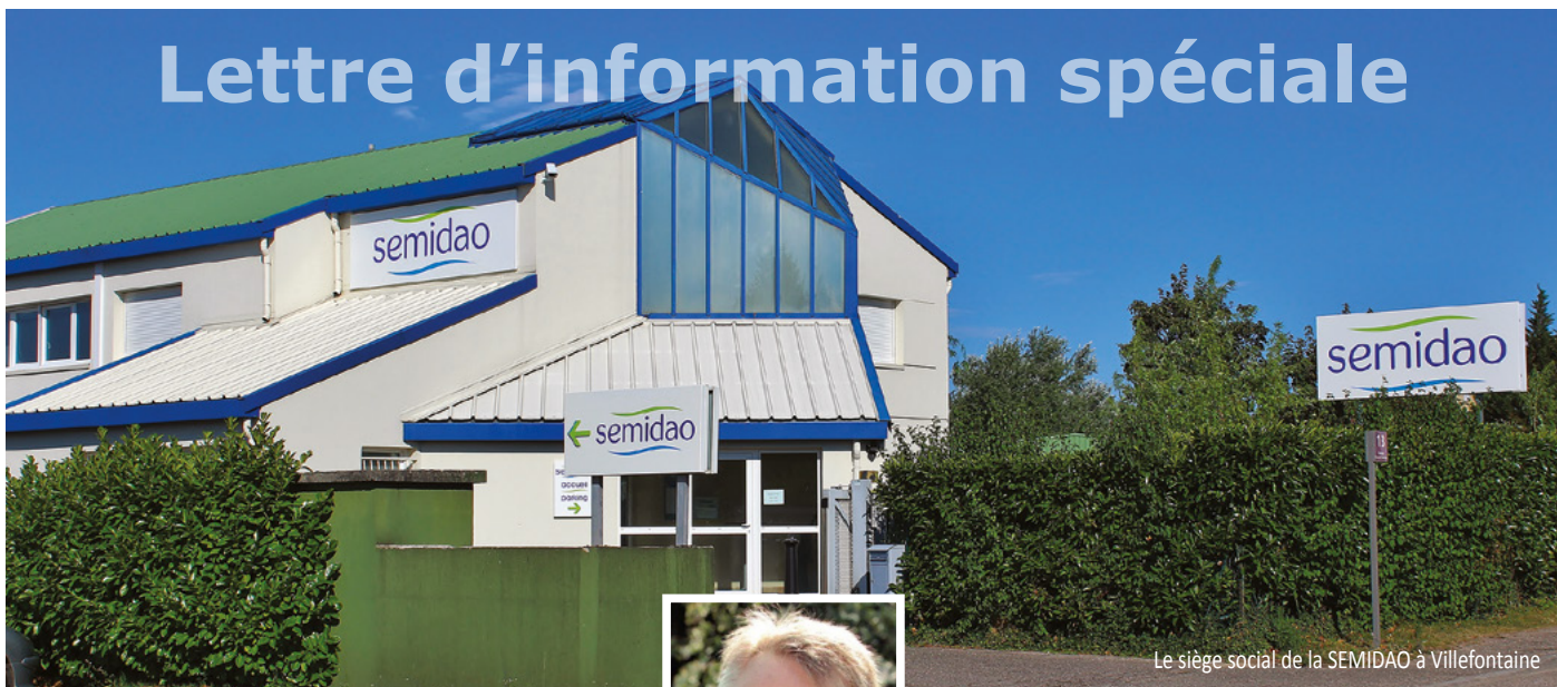
Le siège social de la SEMIDAO à Villefontaine